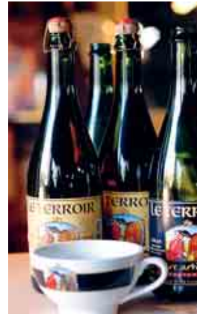
De cider van Cidre du Terroir.