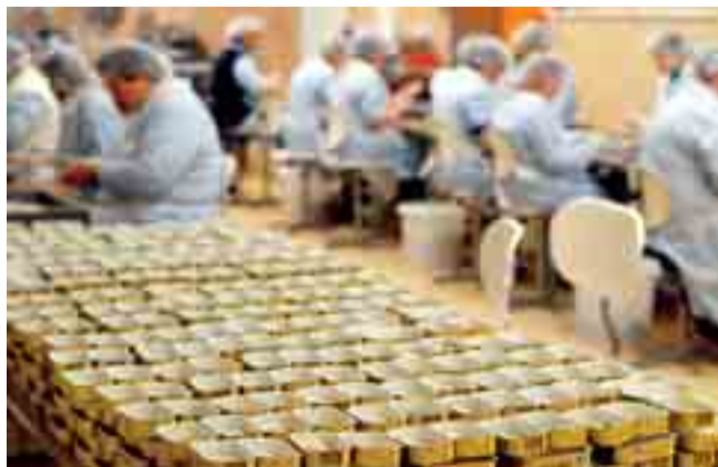
Sardines in Quiberon.