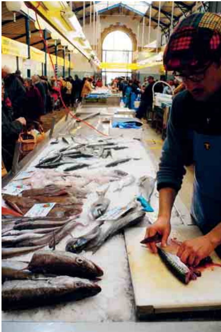
De vishal in Vannes.